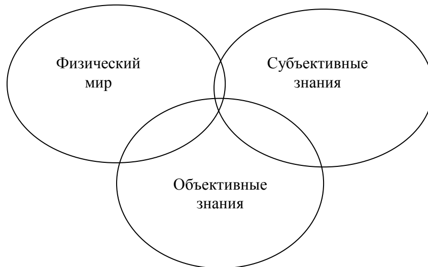
Рис. 3. Три мира К. Поппера

По мнению Брукса, в чем действительно нуждается информационная наука как в основе, так это в теории объективных (конвенциональных) знаний, нежели в теории субъективных (личностных) знаний (29, с. 127). Отметим, что результаты экспериментов по компьютерному моделированию процессов формирования новых концептов позволяют предположить, что построение основ информационно-компьютерной науки нуждается как в теории объективных (конвенциональных) знаний, так и в теории субъективных (личностных) знаний (47).